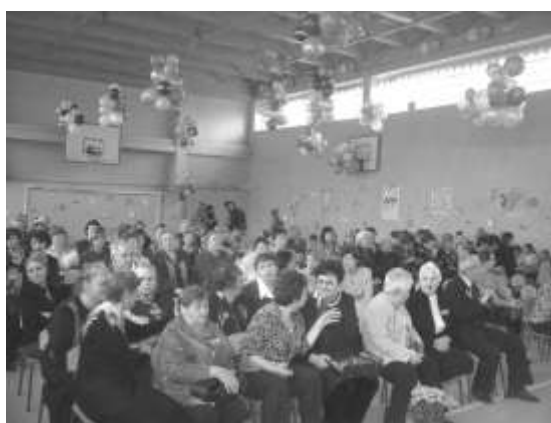
в зале – анилаг