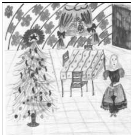
Рисунок Курносовой Ларисы

23, 24 декабря – представление на конкурс новогодних плакатов 5-11 классы. Плакаты принимаются в каб. Никеровой Л.Ю.