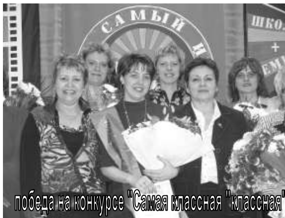
победа на конкурсе "Самая классная" "классная"

же. Хотя вспомнила (смеется)! У нас не было таких пышных платьев. И фантастических причесок. Все было гораздо скромнее. Но к выпускному обязательно покупалось все новое.