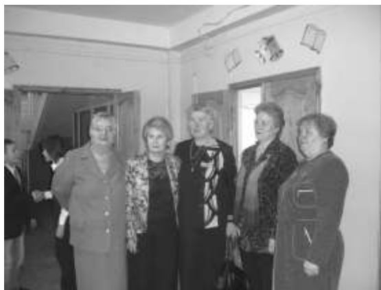
педагоги в предвкушении праздника