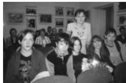
«Посадская лира-2004» Представители 11-й школы

И волхвы побрели, и в смущенье пошли пастухи поклониться младенцу, что спал в Вифлеемской пещере, где струился покой и движения были легки, и светился сам воздух, настоян на чуде и вере.