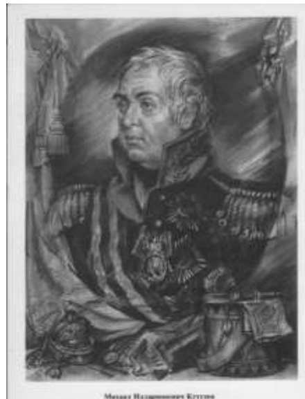
Михаил Илларионович Голенищев-Кутузов, генерал-фельдмаршал

Свою военную службу Милорадович начал под командованием Суворова. Он принадлежал к числу молодых сподвижников великого полководца наряду с Багратионом и Горчаковым. Участник сражения под Аустерлицем, боевых действий на Дунае в 1806—1807 годах. 15 августа 1812 года Милорадович прибыл в действующую армию во главе 15 тысяч подкрепления. При Бородине командовал правым флангом, а в дальнейшем — центром русской армии. Командуя арьергардом русской армии во время отхода к Москве, а затем оставления Москвы, обеспечил полный порядок в войсках. Предложил Мюрату перемирие на несколько часов, чтобы дать возможность русским войскам спокойно выйти из Москвы. В противном случае обещал драться до последнего солдата. Предложение было принято. Во время наступления русской армии преследовал французов, командуя авангардом. С 1818 года был губернатором Петербурга. Во время восстания на Сенатской площади в 1825 году был смертельно ранен. В более чем пятидесяти сражениях счастливо избежавший ранения, он получил в тот день сразу две смертельные раны от революционеров-заговорщиков, и обе — в спину: одну, пулевую, от Каховского и вторую, штыковую, от Оболенского. В своём завещании исполнил один из своих проектов, отпустив своих крестьян (порядка 1500 душ) на волю. Погребён 21 декабря в Духовской церкви Александро-Невской Лавры, в 1937 году его прах и надгробие перенесены в Благовещенскую усыпальницу Санкт-Петербурга.