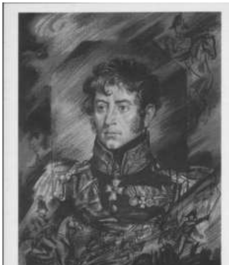
Михаил Андреевич Милорадович, генерал от инфантерии

Свою военную службу Милорадович начал под командованием Суворова. Он принадлежал к числу молодых сподвижников великого полководца наряду с Багратионом и Горчаковым. Участник сражения под Аустерлицем, боевых действий на Дунае в 1806—1807 годах. 15 августа 1812 года Милорадович прибыл в действующую армию во главе 15 тысяч подкрепления. При Бородине командовал правым флангом, а в дальнейшем — центром русской армии. Командуя арьергардом русской армии во время отхода к Москве, а затем оставления Москвы, обеспечил полный порядок в войсках. Предложил Мюрату перемирие на несколько часов, чтобы дать возможность русским войскам спокойно выйти из Москвы. В противном случае обещал драться до последнего солдата. Предложение было принято. Во время наступления русской армии преследовал французов, командуя авангардом. С 1818 года был губернатором Петербурга. Во время восстания на Сенатской площади в 1825 году был смертельно ранен. В более чем пятидесяти сражениях счастливо избежавший ранения, он получил в тот день сразу две смертельные раны от революционеров-заговорщиков, и обе — в спину: одну, пулевую, от Каховского и вторую, штыковую, от Оболенского. В своём завещании исполнил один из своих проектов, отпустив своих крестьян (порядка 1500 душ) на волю. Погребён 21 декабря в Духовской церкви Александро-Невской Лавры, в 1937 году его прах и надгробие перенесены в Благовещенскую усыпальницу Санкт-Петербурга.