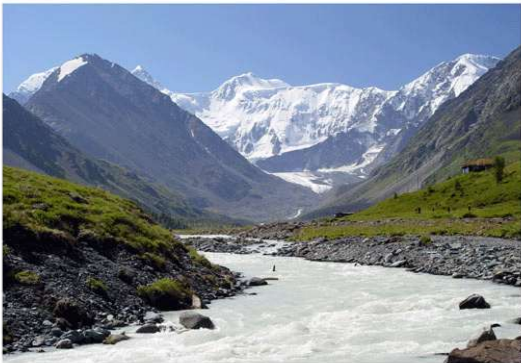
Горный Ламаи. Молочные воды реки Яхем (высота 3700м). От горы Келухе (высота 6106м) - 17 км.