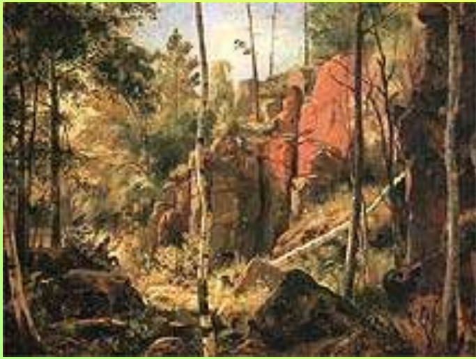
Вид на острове Валааме