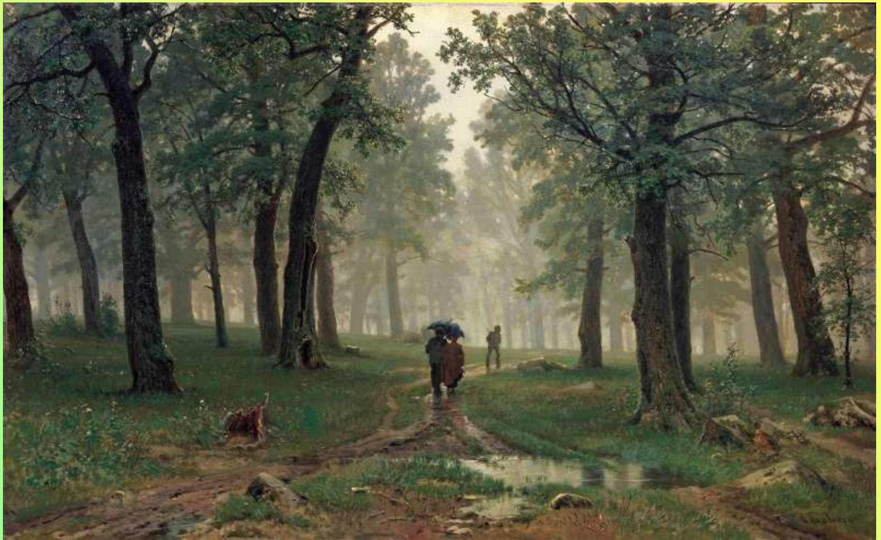
Дождь в дубовом лесу