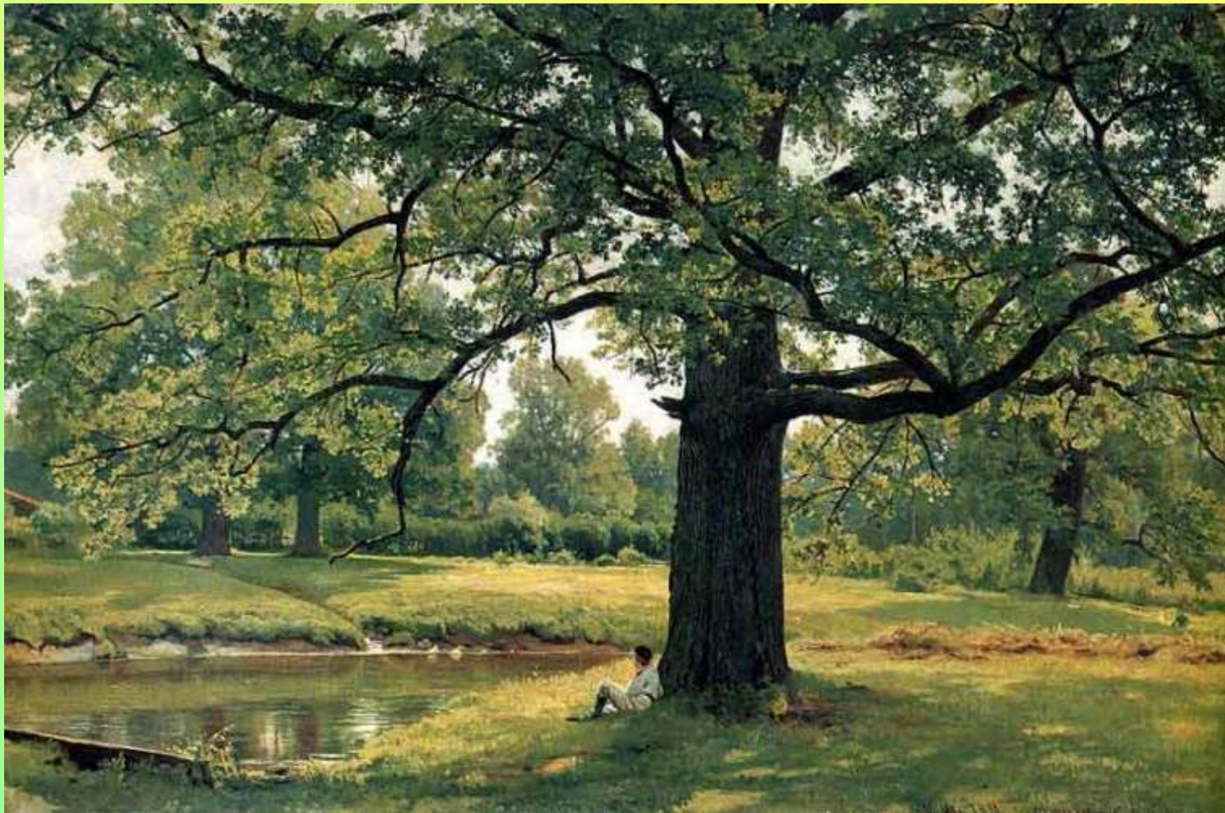
Дубы в старом Петергофе