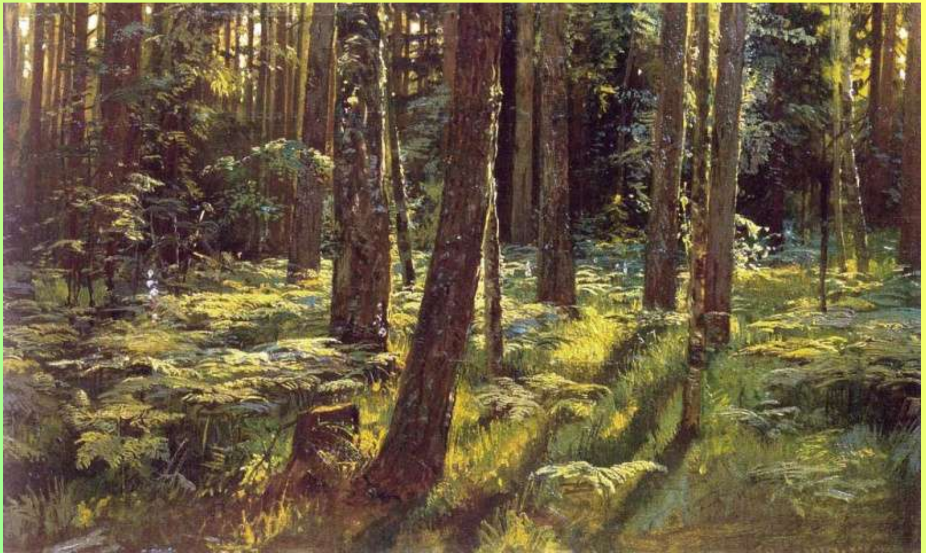
Папоротники в лесу