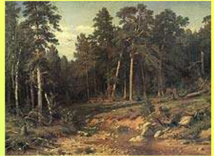
Сосновый бор. Мачтовый лес в Вятской губернии