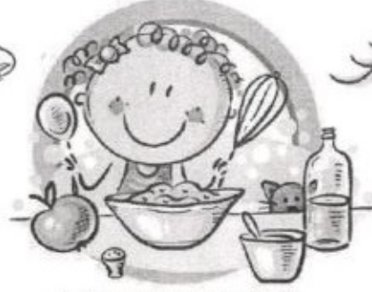
СЛЕДУЙТЕ ПРИНЦИПАМ ЗДОРОВОГО ПИТАНИЯ И ВОСПИТЫВАЙТЕ ПРАВИЛЬНЫЕ ПИЩЕВЫЕ ПРИВЫЧКИ