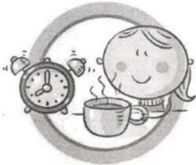
СОБЛЮДАЙТЕ ПРАВИЛЬНЫЙ РЕЖИМ ПИТАНИЯ