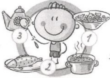
НЕ ПРОПУСКАЙТЕ ПРИЕМЫ ПИЩИ