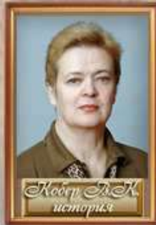
Косой А. К. история